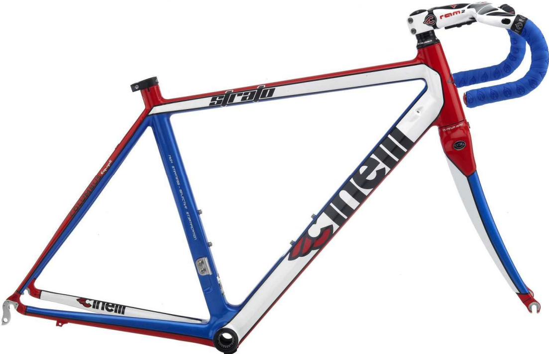
Cinelli Saetta Sprint